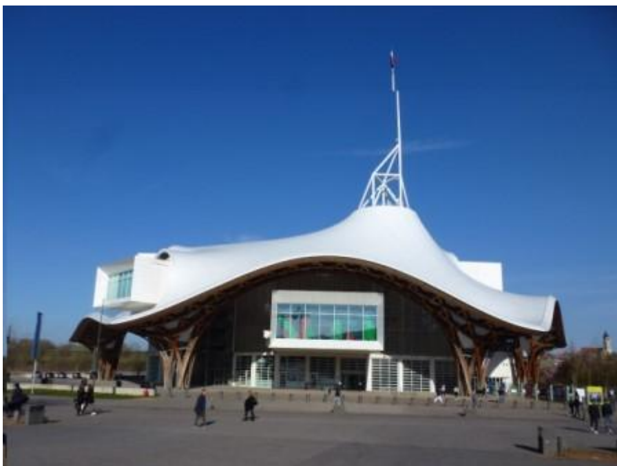
Centre Pompidou Metz